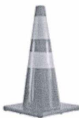
CONO DE SEGURIDAD