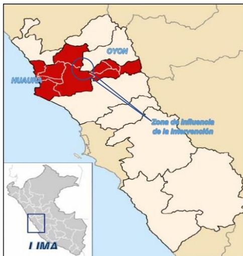
Fig. N° 01: Ubicación de las zonas del proyecto