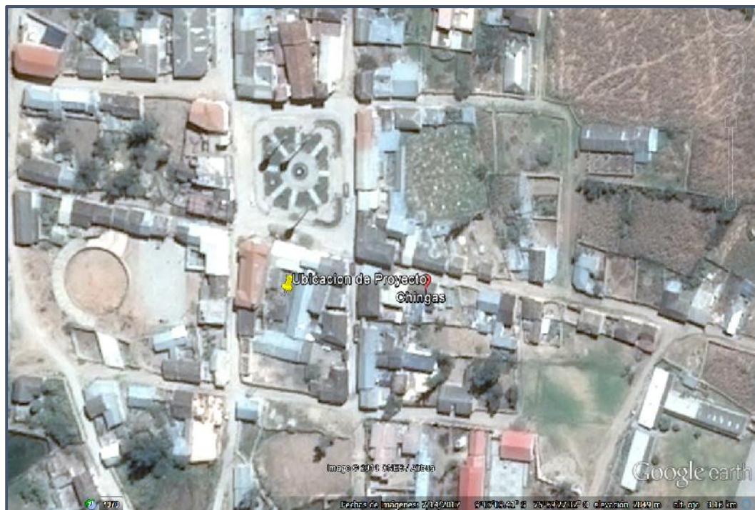
GRAFICO 02: Ubicación del Proyecto