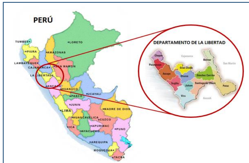
IMAGEN 02. UBICACIÓN GEOGRÁFICA DE LA PROVINCIA DE SÁNCHEZ CARRIÓN