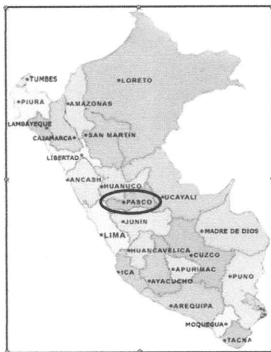
Figura 1. Ubicación Nacional