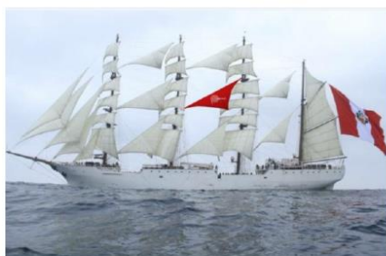
(*) Imagen Referencial de cómo quedaría la vela roja con logo blanco en el buque.

En zonas de costura que sufren un mayor rozamiento deberán ir protegidas con una banda de sacrificio de tela dacron de 60 mm de ancho.