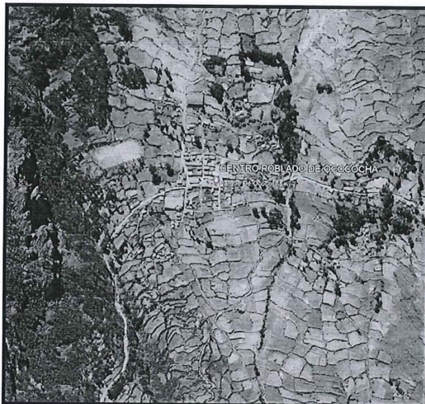
Lugar del proyecto.