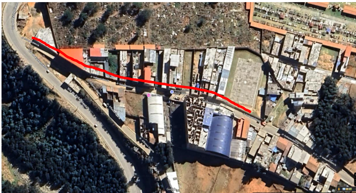
FIGURA 04: IMAGEN 04. UBICACIÓN GEOGRÁFICA DEL LUGAR DEL PROYECTO