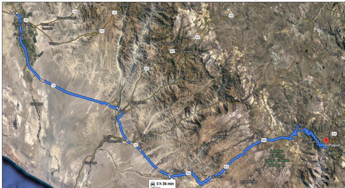
VISTA N°03: VIA DE ACCESO PUQUI - PARARCA