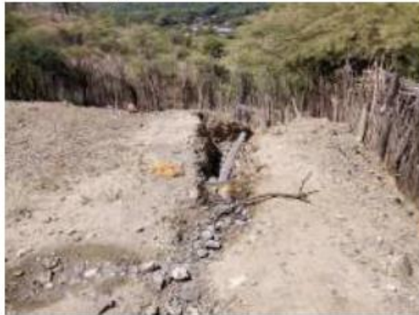
Foto N° 26: Se observa la tubería donde se expulsa lo de los servicios higiénicos a la intemperie.

Carecen de un sistema de alcantarillado. Tienen un silo para los servicios higiénicos. Las aguas servidas de la cocina son arrojadas hacia el exterior de la I.E.