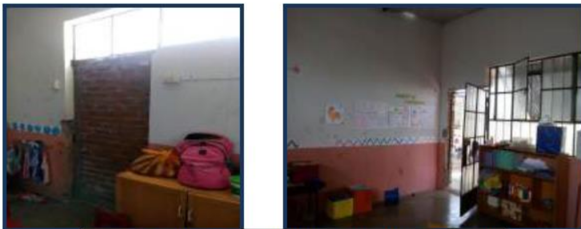
Fotos N° 12,13 : En vistas se observa el interior del aula de 4 y 5 años .No presenta luminosidad debido a un alero de calamina que han puesto en ventana debido al sol fuerte que les llega.