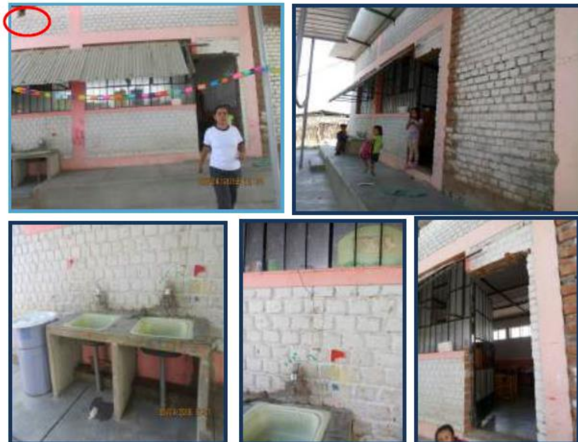
Fotos N°7,8,9,10,11: En vistas, se observa parte frontal del aula de 4 y 5 años. Presenta rajaduras en la pared frontal, donde han construido 02 lavaderos. Se observa que las ventanas han sido cubiertas con calamina debido al fuerte sol que les llega a los niños, provocando baja luminosidad y a la vez genera mucho calor a los niños.