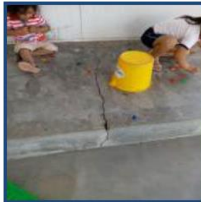
Foto N° 3,4 : En vista se observa parte frontal del aula pre fabricada donde alberga a niños de 3 y 4 años, sin embargo presenta rajaduras en las veredas frontal y posterior