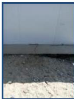
Fotos N°5,6: En vistas se observa parte posterior y lateral del aula, presenta grietas en la vereda lateral.

El aula de 4 y 5 años, se ubica en el pabellón 1, por el ingreso principal de la Institución, distribuida frente al patio de formación. Fue construida el año 1994 por FONCODES, tiene una antigüedad de aproximadamente 25 años, habiendo cumplido su vida útil. Paredes de ladrillo. Presenta rajaduras en la pared frontal donde se han construido 02 lavaderos. Presenta ventanas y puerta de fierro con lunas. El piso interior del aula es de cemento pulido, techo de Eternit y recientemente han colocado por las ventanas frontales un tipo alero de calamina debido al fuerte sol que les llega a los niños, sin embargo, estos materiales no son recomendables en climas calurosos como el de la zona, ya que producen recalentamiento en las aulas, aumentando el calor y generando incomodidad y por consiguiente pérdida de concentración en los alumnos, además contradictoriamente les genera poca luminosidad en el aula. Puerta y ventanas de fierro. Los niños desarrollan sus actividades escolares en condiciones no adecuadas. El aula se encuentra en mal estado de conservación., no cumpliendo con las normas técnicas de diseño para nivel inicial.