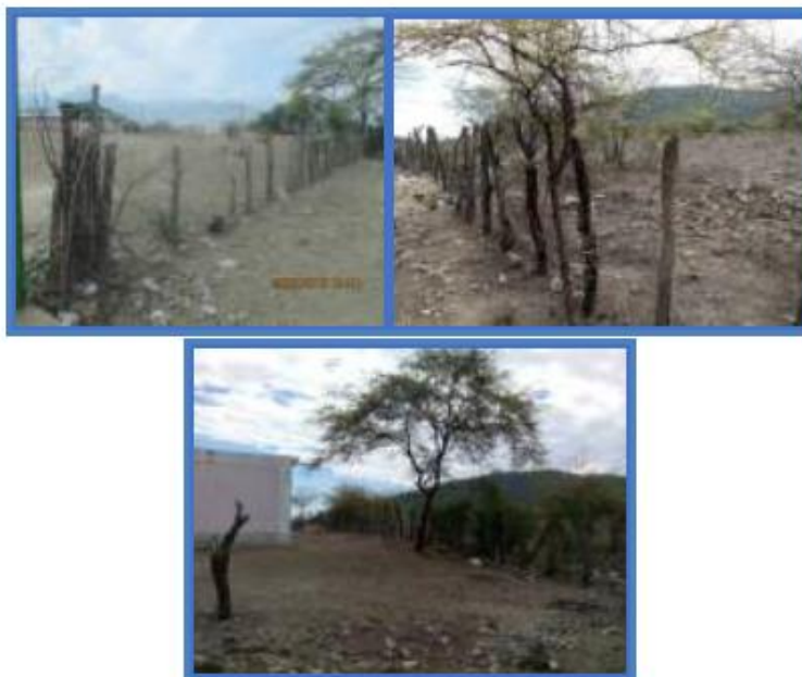
Fotos N° 74 al 76 : En vistas se observa cerco perimétrico de palos de algarrobo con alambre de púas en todo el perímetro de la Institución, no proporciona seguridad a la población escolar.

Pese a que es de gran importancia contar con un cerco perimétrico que le permita a la I.E. proporcionar seguridad a la población escolar, así como a su infraestructura y equipamiento, esta institución no cuenta con uno que brinde el respaldo deseado ya que la I.E. está cercada 660.00 ml. por palos de algarrobo con alambres de púas en todo el perímetro del terreno presentando un pórtico de ingreso conformado por un portón metálico a dos hojas para el ingreso y salida de los alumnos.