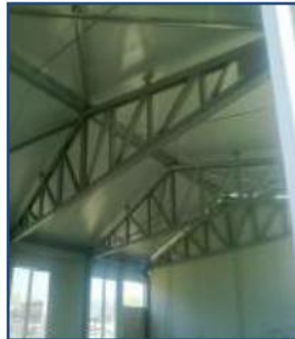
Fotos N° 38, 39: En vistas se observa, la parte frontal y el interior del aula prefabricada. Se encuentra operativa pero carece de los estándares de seguridad que son necesarios.

En el pabellón 2 se ubica las aulas de 4to, 5to y 6to grado de primaria.