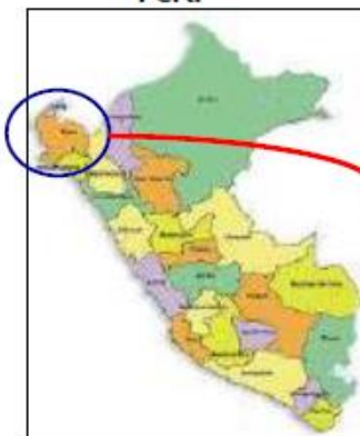
Ubicación Dpto Piura en Perú

➤ Vía Piura – Chulucanas, cuya distancia es 60 Km. por carretera asfaltada, con un recorrido promedio de una (01) hora en auto u ómnibus. ➤ Chulucanas-Centro Poblado Balcones de Talandracas, por una trocha carrozable, con un recorrido promedio de treinta (30) minutos, en moto taxi, medio de transporte más común en la zona.