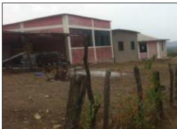
Fotos N° 36, 37: Se observa la parte frontal y posterior del aula de 2do grado. Se recomienda demoler

El aula donde funciona 3er grado es un aula pre fabricada la cual se encuentra en un estado operativo desde el año 2011. Pero se recomienda desarmarla ya que no cuenta con las medidas de seguridad necesaria.