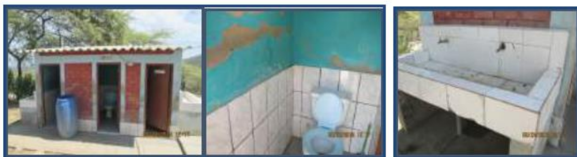
Fotos N° 63 al 65 : En vistas , se observa el interior y exterior de los SS.HH nivel primaria. Mal estado de conservación.. Vista de lavaderos en malas condiciones llaves de lavaderos malogrados

Dos (02) módulos de Servicios Higiénicos de albañilería confinada con techo de Eternit y vigas de madera. Cada módulo tiene tres compartimientos con un Inodoro cada uno, tanto para los alumnos y docentes, piso de cerámico y zócalo de cerámico (h = 0.90 m), tienen 2 lavatorios de concretos revestidos de cerámico en cada módulo ubicados en el exterior adosados a los muros laterales. Un módulo de SS.HH. se encuentra ubicado detrás del aula de primer grado y el otro módulo se ubica detrás de las aulas de quinto y sexto grado de primaria. Todos se encuentran en mal estado de conservación.