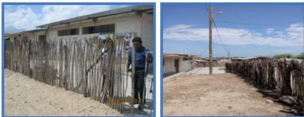
Foto N° 25: Se observa el cerco perimétrico que no representa ninguna seguridad a la I.E.I,

Cuenta con un cerco perimétrico rústico a base de palos de algarrobo y overal amarrado con alambres que no brinda seguridad a la comunidad escolar ni a la infraestructura. Como se puede observar en la siguiente toma fotográfica: