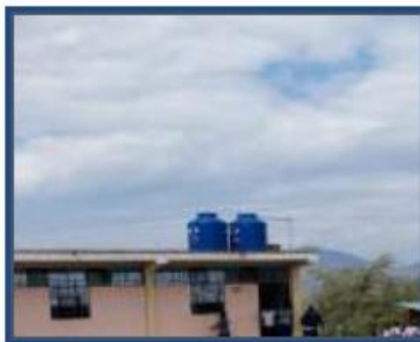
Foto 77: La I.E. cuenta con 02 tanques elevados que los abastece cuando la JASS corta el agua.

Carecen de un sistema de alcantarillado. Tienen pozo ciego para los servicios higiénicos y las aguas servidas de la cocina y lavamanos van hacia el exterior, originando humedad, contaminación, lo que puede conllevar a la proliferación de zancudos, problemas de piel en los niños.