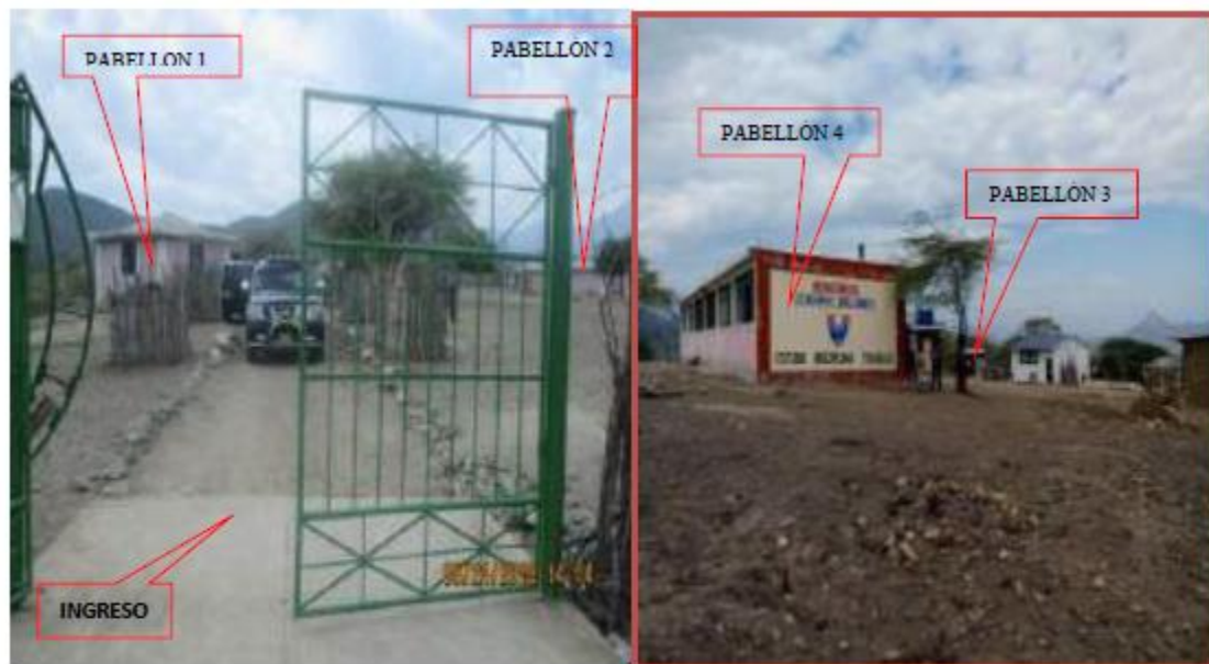
Fotos N° 31,32: Se aprecia en la toma fotográfica la ubicación de los pabellones en la I.E.

El ingreso principal a la Institución Educativa N° 14891 está constituido por una puerta de rejas metálica a dos hojas que no brinda seguridad especialmente a la población estudiantil, tal como se observa en la siguiente toma fotográfica: