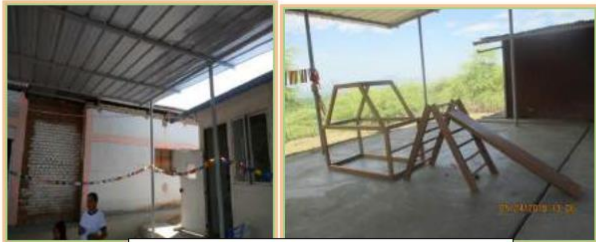
Foto N°24: Se observa en el patio de formación piso de cemento y la instalación de una resbaladora que representa un grave riesgo para los niños.