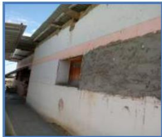
Foto N° 19 y 20 : Se observa la parte posterior de los ambientes de servicios en malas condiciones.