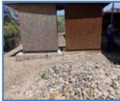
Fotos N°20 , 21,22 : En vistas se aprecia parte frontal y posterior de los SS.HH en malas condiciones. Tapa del inodoro rajada.