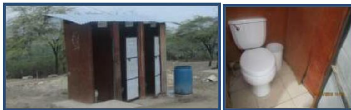
Fotos N° 69 , 70: Se aprecia los SS.HH. nivel secundaria, que son utilizados por docentes y alumnos .Mal estado de conservación.

El módulo de Servicios higiénicos consta de tres compartimientos que en su interior albergan un inodoro cada uno, esta infraestructura se encuentra en mal estado de conservación, paredes de triplay y techo de calamina. Lo utilizan docentes y alumnos. Se abastece de agua de un tanque cisterna y un reservorio de PVC ubicados adyacentes al muro lateral del block de dos aulas, aquí también se encuentra un lavatorio de concreto revestido con cerámico celeste.