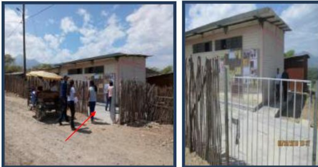
Foto N° 1,2: En vistas, se observa el ingreso principal a la I.E. N° 441 constituido por reja metálica y el cerco perimétrico rústico.

La Institución Educativa N° 441 cuenta con 02 aulas donde desarrolla sus actividades escolares del nivel inicial: