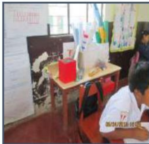
Fotos N°48,49: Se observa caja de energía expuesta al interior del aula, representando un peligro para los niños.