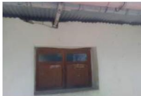
Fotos : 15, 16,17 y 18 : En vistas se observa parte frontal e interna de los ambientes de servicios en malas condiciones.