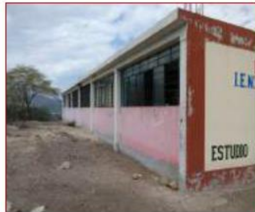
Fotos N° 52, 53 : En vistas se observa parte posterior y lateral del pabellón 4.No cuenta con veredas, lo que la cimentación queda al descubierto.