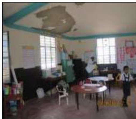
Fotos N° 34, 35: Se observa la parte frontal y el interior del aula de 1er grado. Techo resanado, piso de cemento. No cuenta con sistema de drenaje pluvial.

El aula donde funciona 2do grado es de adobe, techo de calamina, fue construida por los padres de familia aproximadamente 09 años. Se encuentra en mal estado ya que representa un peligro latente para los estudiantes pues sus paredes están debilitadas a causa de las precipitaciones pluviales, especialmente el más reciente fenómeno del niño costero ocurrido el 2017. Cuenta en la parte frontal con cunetas con rejillas de drenaje pluvial, Teniendo en cuenta la opinión técnica se recomienda demoler por el pésimo estado en el que se encuentra esta aula.