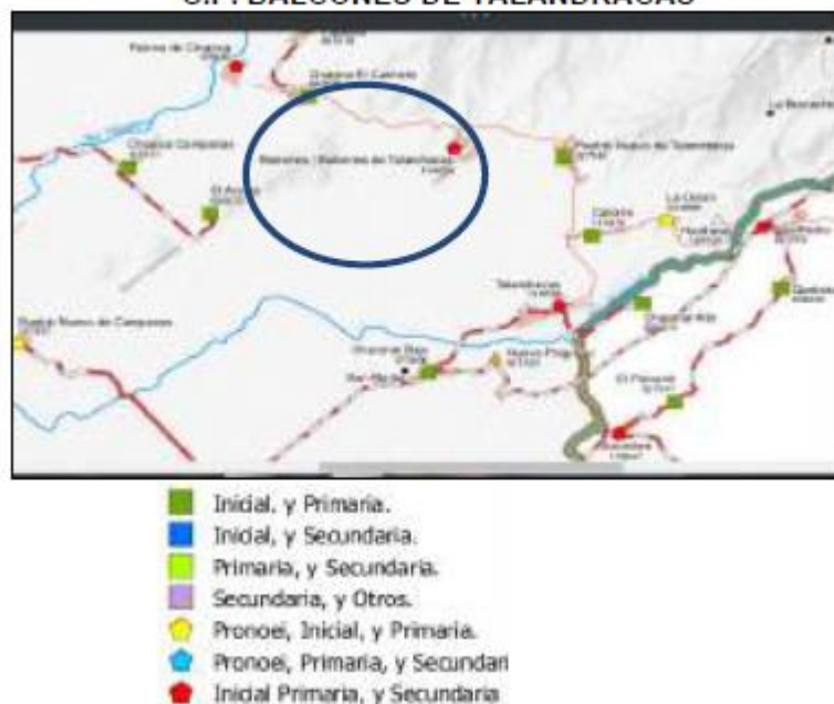
IMAGEN N° 4 ÁREA DE ESTUDIO Y ÁREA DE INFLUENCIA C.P. BALCONES DE TALANDRACAS

El área de influencia de la I.E. N° 14891 nivel primario se delimita alrededor de 4.0 km de distancia de donde se ubica la Institución Educativa. Dentro de este radio de acción (4 Km.) se ha podido ubicar las Instituciones Educativas N° 15361 y 14630 que se consideran instituciones Alternativas del nivel primario de la I.E N° 14891, ubicadas en los Centros Poblados Chapico Carmelo y Pueblo Nuevo de Talandracas respectivamente, tal como se observa en el cuadro 5.