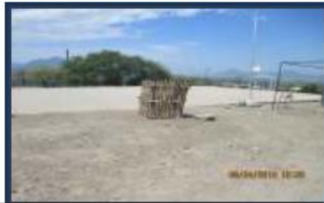
Fotos N°72 ,73 : En vistas se observa plataforma deportiva concreto pobre, sin cobertura.

Pese a que es de gran importancia contar con un cerco perimétrico que le permita a la I.E. proporcionar seguridad a la población escolar, así como a su infraestructura y equipamiento, esta institución no cuenta con uno que brinde el respaldo deseado ya que la I.E. está cercada 660.00 ml. por palos de algarrobo con alambres de púas en todo el perímetro del terreno presentando un pórtico de ingreso conformado por un portón metálico a dos hojas para el ingreso y salida de los alumnos.