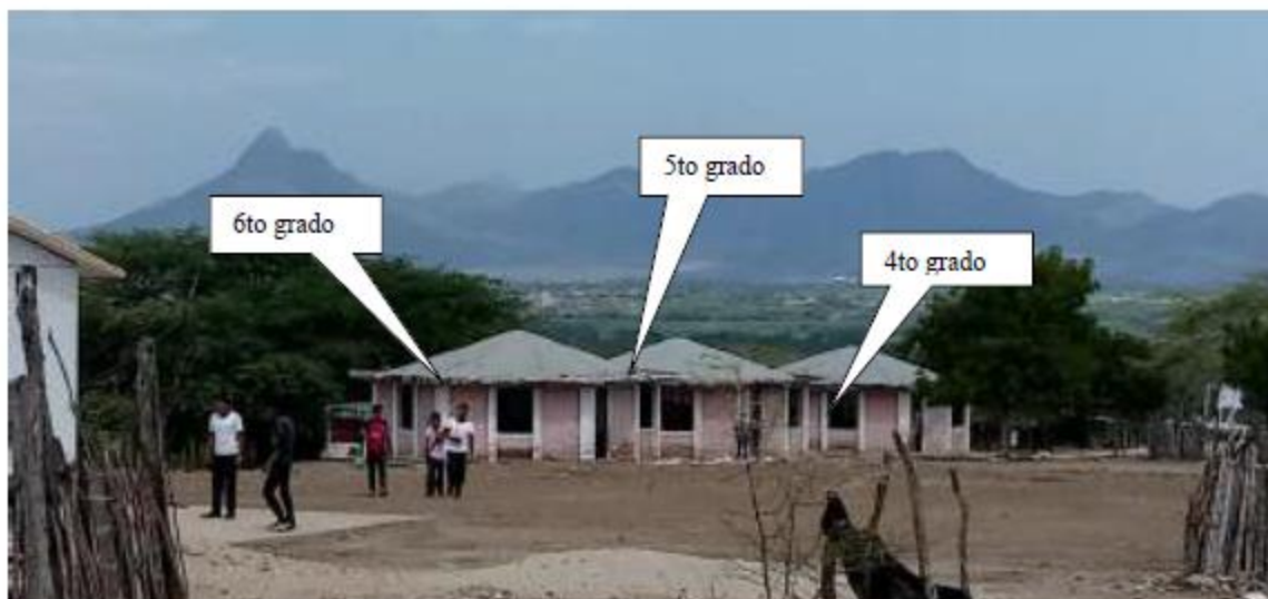
Fotos N° 40, 41, 42 : En vistas, se observa frontis del pabellón 2, donde se ubican las aulas de 4to, 5to y 6to grado del nivel primario.

Las tres aulas al igual que la de primer grado, son de forma hexagonal. Cuentan con veredas perimetrales sin embargo presentan grietas, no cuentan con cunetas perimétricas de drenaje pluvial, lo que ha debilitado sus estructuras. Las paredes presentan humedad con presencia de sales.