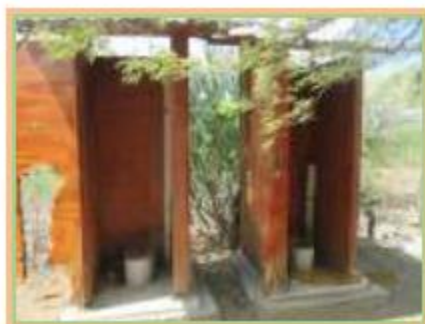
Foto N°71 : En vistas ,se observa el mal de estado de conservación de las letrinas. Ya colapsaron.

La Institución Educativa cuenta con 02 letrinas que están clausuradas, ya colapsaron. Mal estado de conservación. Se ubican en el pabellón 2, detrás de las aulas de primaria.