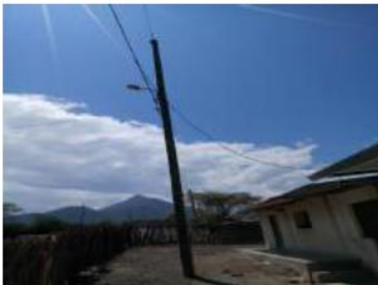
Foto N°27: En vista, se observa un poste de energía eléctrica dentro del área de la I.E. representando un peligro para los niños.

La Institución educativa sí cuenta con el servicio de energía eléctrica.