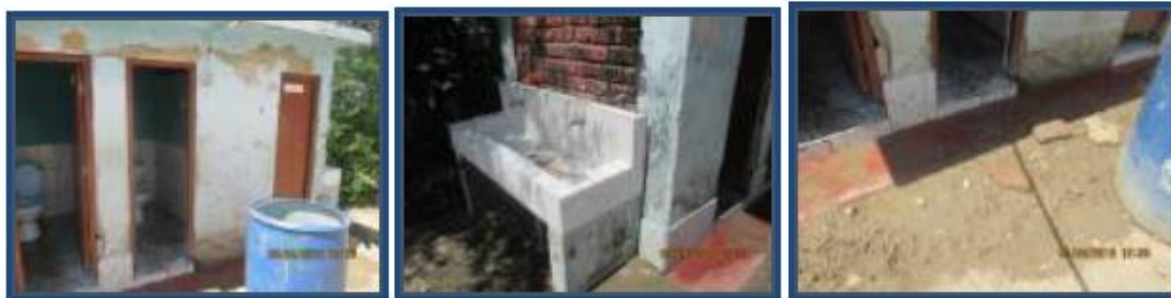
Fotos N° 66 al 68: En vistas se observa otra batería de SS.HH. nivel primaria en mal estado de conservación, para docentes y alumnado.