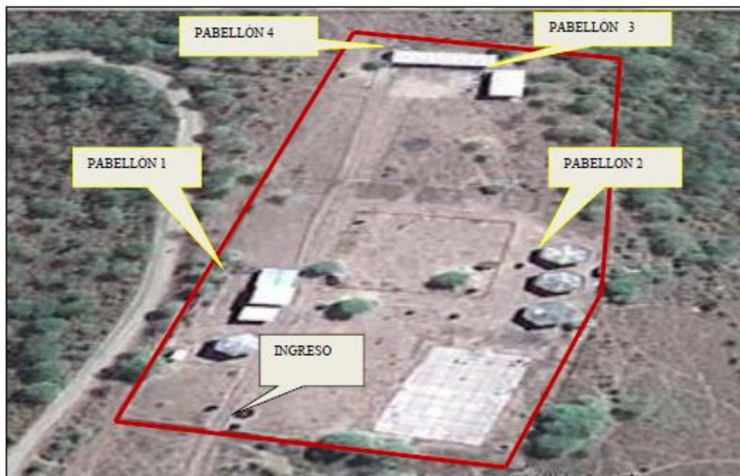
CUADRO N° 22 AMBIENTES ACTUALES EN LA I.E. 14891