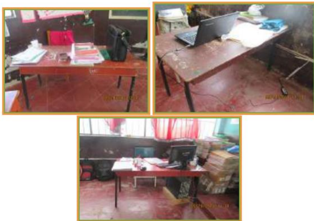
Fotos N° 92 al 94 : En vistas se observa que carecen de mobiliario para los docentes, Dirección.