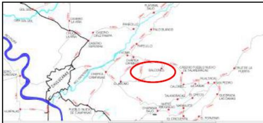
IMAGEN N° 3 UBICACIÓN DE LAS I.E. N° 441 Y 14891 EN EL CENTRO POBLADO BALCONES DE TALANDRACAS