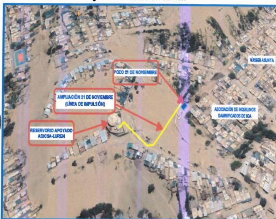
Figura 01. Ubicación del Servicio

El presente Servicio se ubica en el distrito de Ica, provincia de Ica, región de Ica, se encuentra localizado a una distancia de 4.5km. de la ciudad de Ica y a una altitud de 455 m.s.n.m.