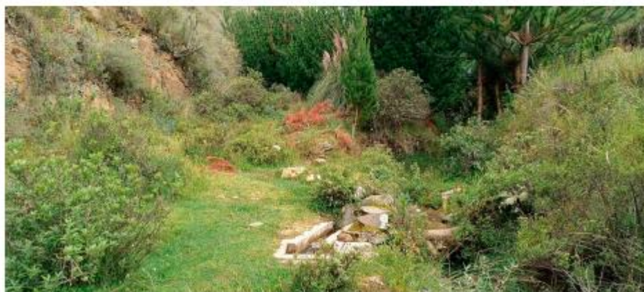
Imagen 2: Situación actual