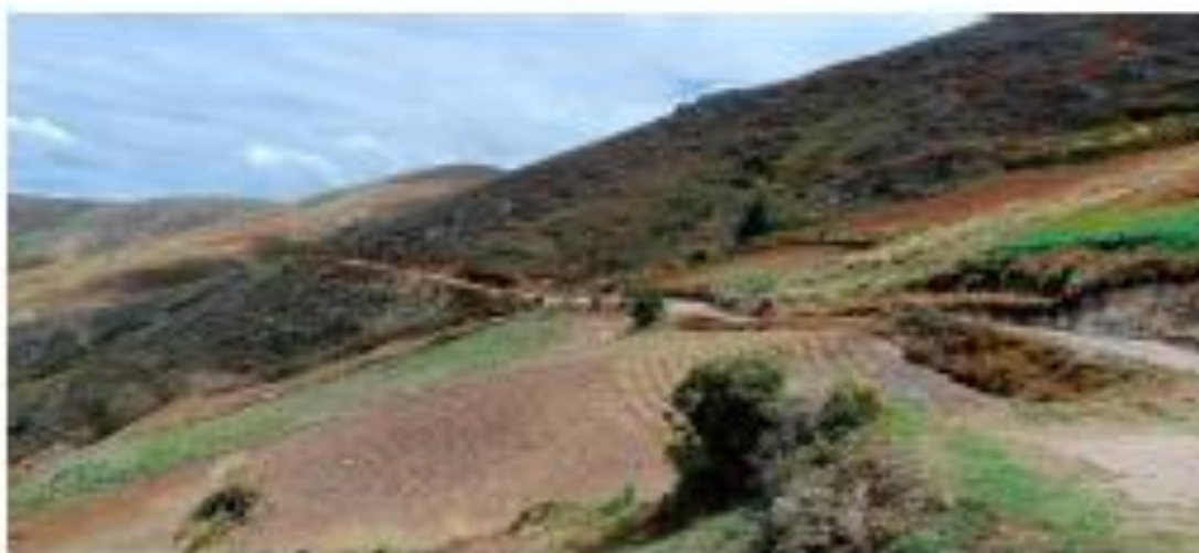
Imagen 4: Situación actual