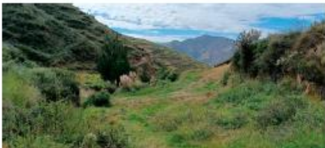
Imagen 3: Situación Actual