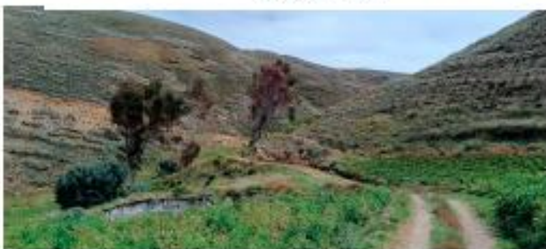
Imagen 5: Situación actual