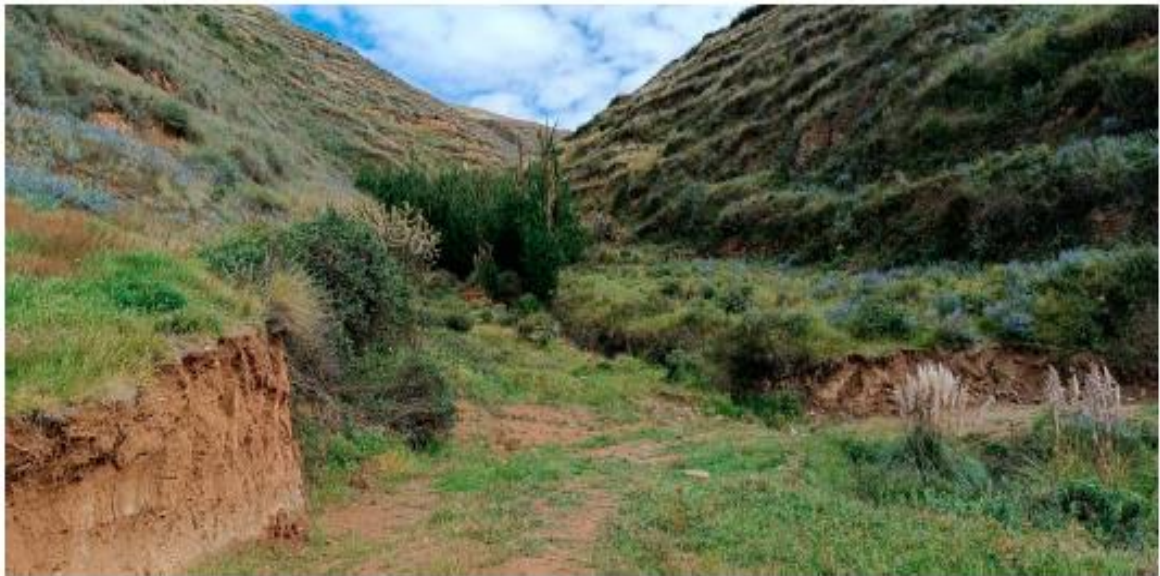
Imagen 6: Situación actual