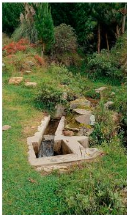
Imagen 1: Situación actual