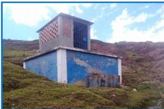
Foto 03: Muestra el reservorio de Shuypillay Alto, se puede observar la caseta de válvulas deteriorado y el sistema de cloración inconcluso