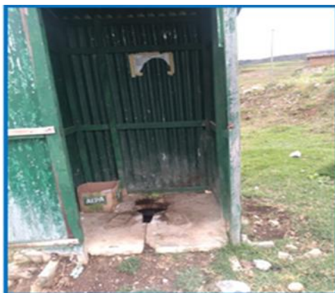
Foto 07: Muestra las características de las viviendas en Shuypillay

Las familias en su mayoría hacen sus necesidades fisiológicas al aire libre en los bosques aledaños, chacras u otros. Con financiamiento de FONCODES, en el año de 1998, se instalaron letrinas sanitarias de hoyo seco, actualmente se encuentran en mal estado como se muestra en la siguiente foto.