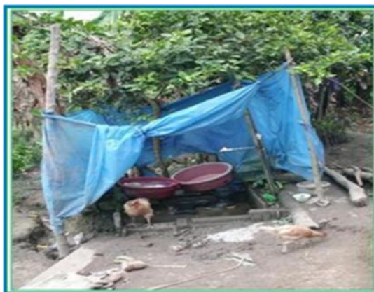
Foto 05: Muestra una Conexión domiciliaría en pésimas condiciones

Se pudo verificar que existen conexiones domiciliarias para 80 viviendas, funcionando en forma limitada (10 conexiones en Velapacha, 18 conexiones en Shuypillay Alto y 52 conexiones en Shuypillay Centro)