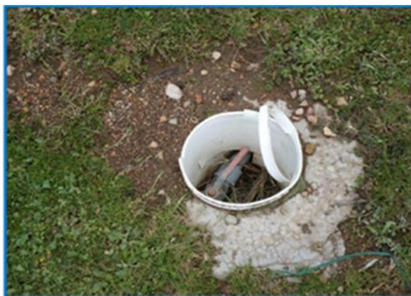
Foto 06: Muestra una válvula de control de 1 1/2" sin caja de protección