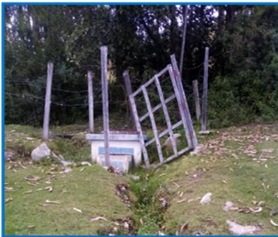
Foto 01: Muestra una de captaciones de Shuypillay Alto, con cercos de madera y alambre de púas deteriorado

Las captaciones operan limitadamente, por limitado caudal que disponen, sobre todo en épocas de estiaje.