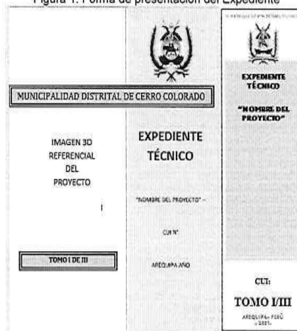
Figura 1. Forma de presentación del Expediente

Los expedientes deberán ser presentados en archivadores de palanca de lomo ancho. Cada archivador deberá considerar una carátula en la parte frontal y en lomo del mismo, para una rápida verificación. Se recomienda que dichas carátulas, deberán indicar como mínimo, lo indicado en la figura 1.