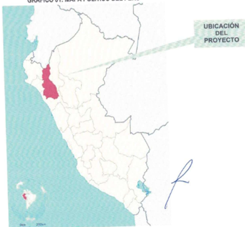
GRAFICO 01: MAPA POLÍTICO DEL PERÚ