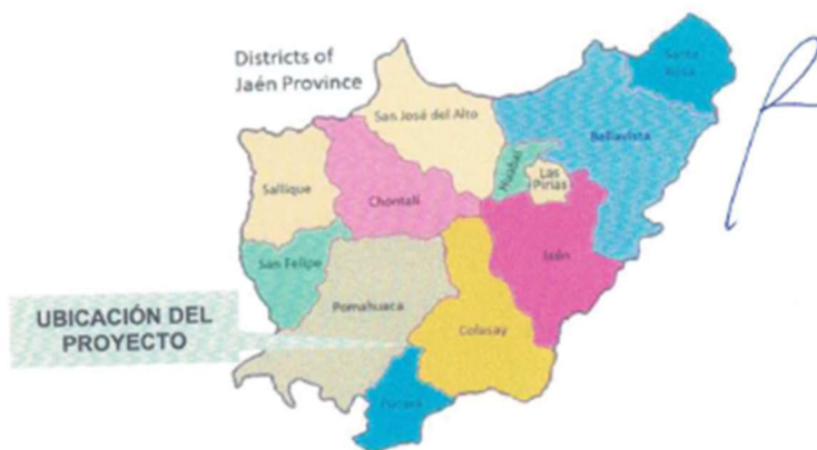
GRAFICO 03 Y 04: MAPA PROVINCIAL DE JAEN