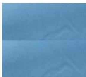
DISEÑO DE MANGAS