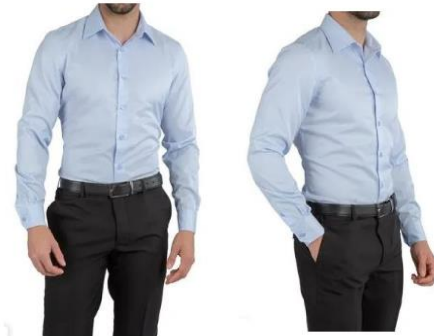
DISEÑO DE CAMISA