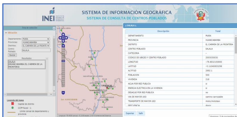
IMAGEN N° 01: CONSULTA DE UBIGEO DE CENTRO POBLADO EN DATA DEL INEI

Se deberá colocar el ubigeo de cada centro poblado del proyecto, según se muestra en la data del INEI. Para esto, se podrá acceder al sitio web: http://sige.inei.gob.pe/test/atlas/ .