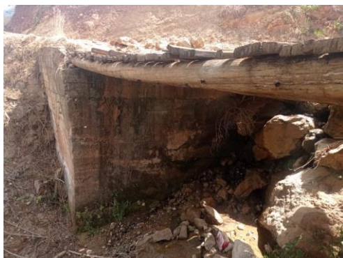
Ilustración 1 Estado actual del puente.