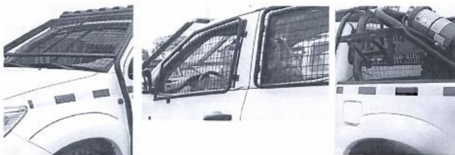
Mallas de seguridad en parabrisas delantero y posterior, y lunas laterales, barra antivuelco y portaextintor (imagen referencial).