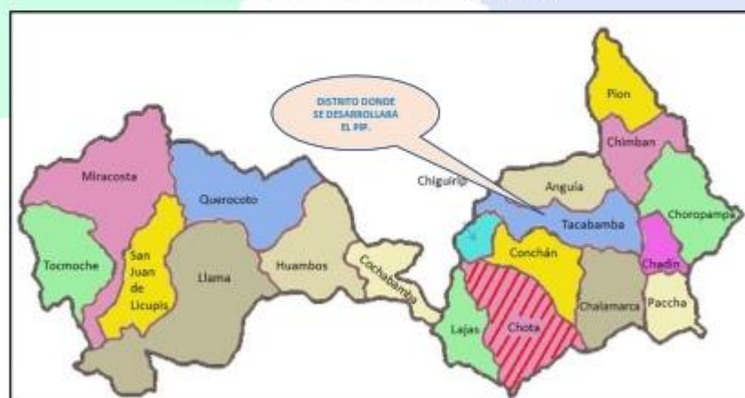
Mapa 2. Ubicación geográfica del distrito de Tacabamba