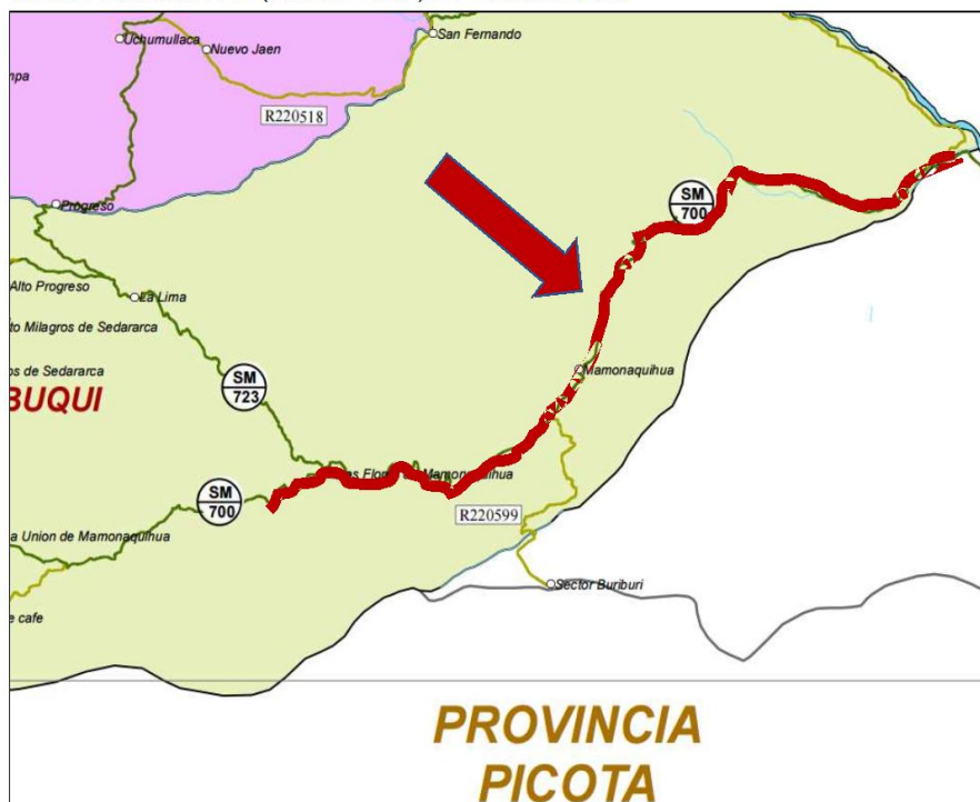
Fig. 01. LÍMITE PROVINCIAL (KM 8+012) - MAMONAQUIHUA – FLORES DE MAMONAQUIHUA (KM 25+497), L= 17.485 KM.

Servicio de ejecución del mantenimiento rutinario del camino vecinal, Tramo: LÍMITE PROVINCIAL (KM 8+012) - MAMONAQUIHUA – FLORES DE MAMONAQUIHUA (KM 25+497), L= 17.485 KM.