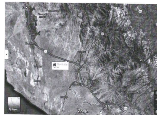
Figura N° 4: Mapa de Accesibilidad