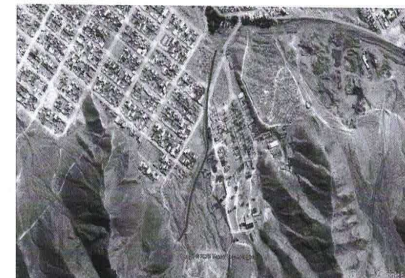
Figura N° 01: Área de Influencia a intervenir con el expediente técnico

La Municipalidad Provincial De Nasca, a través de sus órganos competentes, han formulado el expediente técnico denominado “ CREACIÓN DEL SERVICIO DE PROTECCIÓN EN RIBERAS DE LA QUEBRADA DEL AA.HH ASOCIACIÓN DE VIVIENDA LAS DUNAS DE VISTA ALEGRE ANTE EL PELIGRO DE INUNDACIÓN/SOCAVACION DISTRITO DE VISTA ALEGRE – PROVINCIA DE NASCA – DEPARTAMENTO DE ICA”