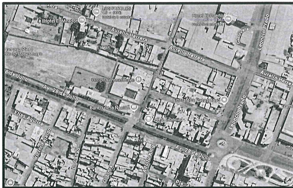
Imagen N° 1: Ubicación del Hospital Distrital de Pacasmayo

La zona donde se ejecutará el mantenimiento se encuentra ubicado en el distrito de Pacasmayo perteneciente a la provincia de Pacasmayo del departamento de La Libertad. El acceso a la zona del mantenimiento es desde la Av. Mariscal Cáceres N° 701.