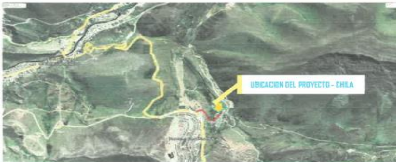
Imagen satelital -Acceso desde CHALLHUAHUACHO a la I.E.P IEP 50664 CHILA.