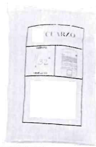
Arena de cuarzo