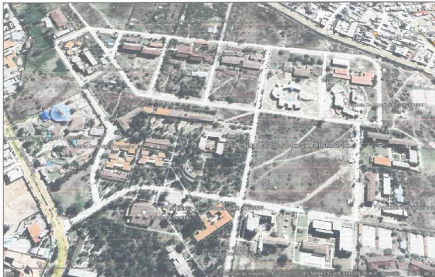
Gráfico 2 Área Urbana De La Zona Del Proyecto