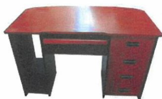
Imagen referencial N° 1