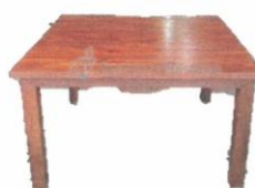
Imagen referencial N° 2