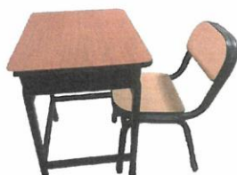
Imagen referencial N° 3