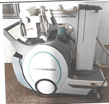
FLAT PANEL PARA EQUIPO DE RAYOS X RODABLE DIGITAL SHIMADZU MODELO: MOBILEART EVOLUTION MX8C