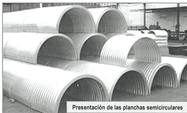
Presentación de las planchas semicirculares

El producto final posee una capa de recubrimiento de zinc UNIFORME en toda la plancha corrugada. El acabado debe ser liso, de tal forma que no existan grumos o zonas con mala adherencia del zinc al metal base (exfoliaciones, desprendimiento de zinc, gotas, etc)