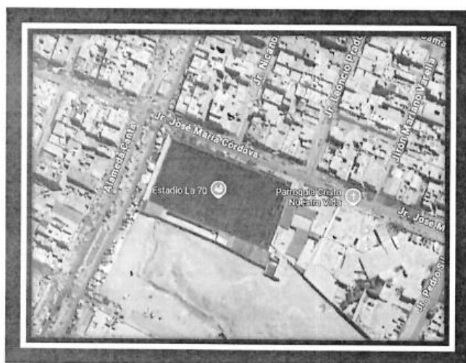
Imagen satelital del área del proyecto