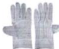
GUANTES DE CUERO

Para determinar que los postores cuentan con las capacidades necesarias para ejecutar el contrato, el órgano encargado de las contrataciones o el comité de selección, según corresponda, incorpora los requisitos de calificación previstos por el área usuaria en el requerimiento, no pudiendo incluirse requisitos adicionales, ni distintos a los siguientes: