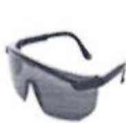
LENTES DE SEGURIDAD