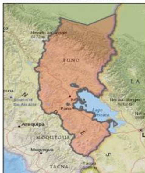
DEPARTAMENTO DE PUNO