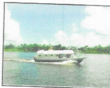
MOTONAVE (RAPIDO - EXPRESO)

CONSULTORIA DE OBRA PARA SUPERVISION DE OBRA: "CREACION DE LOS SERVICIOS DE EDUCACION INICIAL DE LA IEIP N 955 DE LA LOCALIDAD DE PUERTO ELVIRA, DISTRITO DE TORRES CAUSANA - MAYNAS - LORETO", CUI Nº 2253086