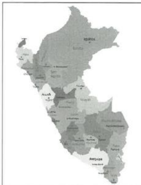
IMAGEN N° 01 - ESQUEMA DE LOCALIZACIÓN DEL PROYECTO.