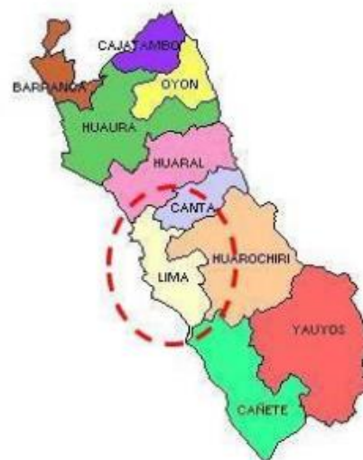
Provincia de Lima