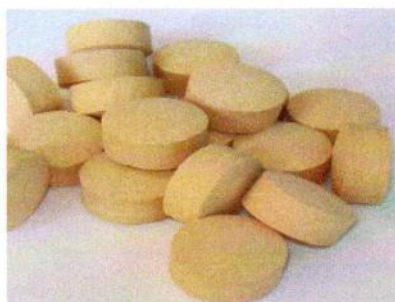
Pellets o pastillas de levadura de torula