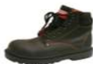
ZAPATO DE SEGURIDAD