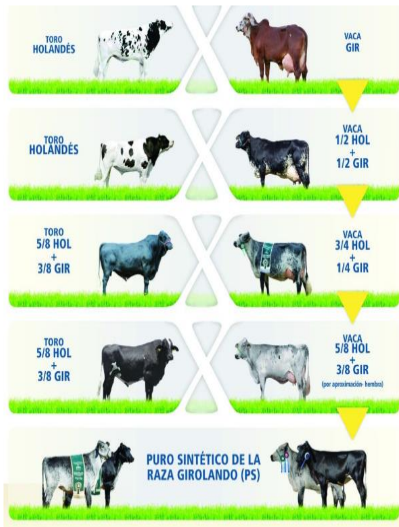
Figura 1. Estrategias de cruces para obtención de animales PS utilizando toros de la raza Holstein en las dos primeras generaciones y toro Girolando 5/8 en las generaciones siguientes.