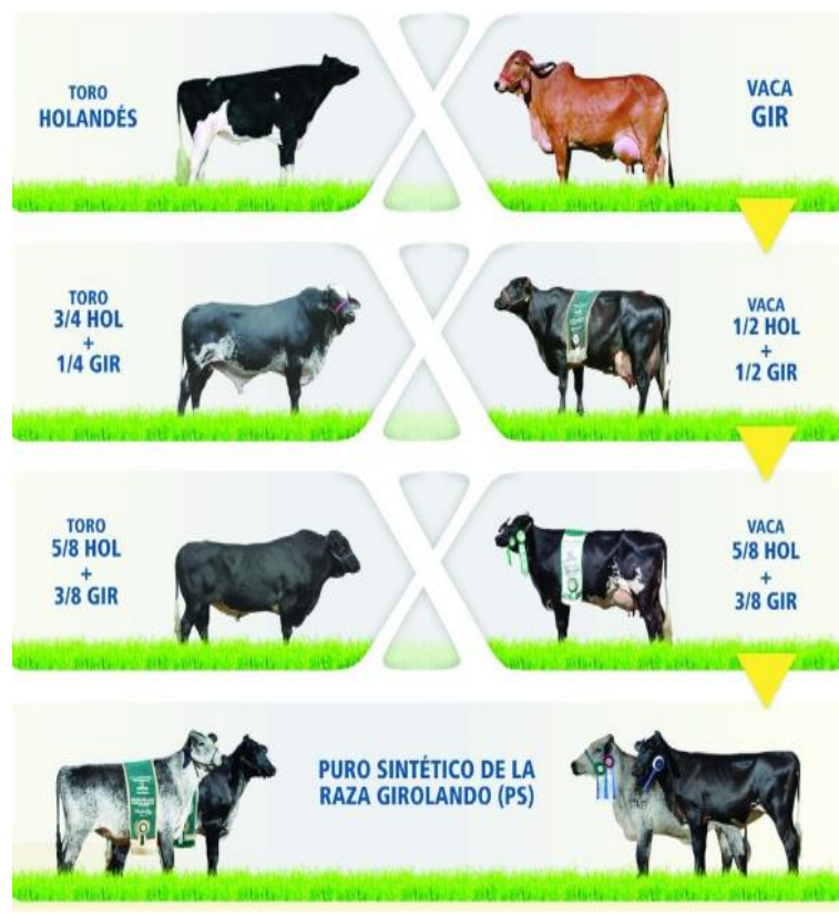
Figura 3. Estrategia de cruce para la obtención de animales PS, utilizando toro de la raza Holstein en la primera generación, toro Girolando 3/4 en la segunda generación y toro Girolando 5/8 en la tercera generación.