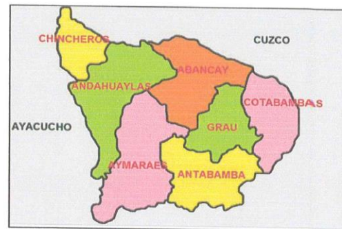
MAPA DE PERU