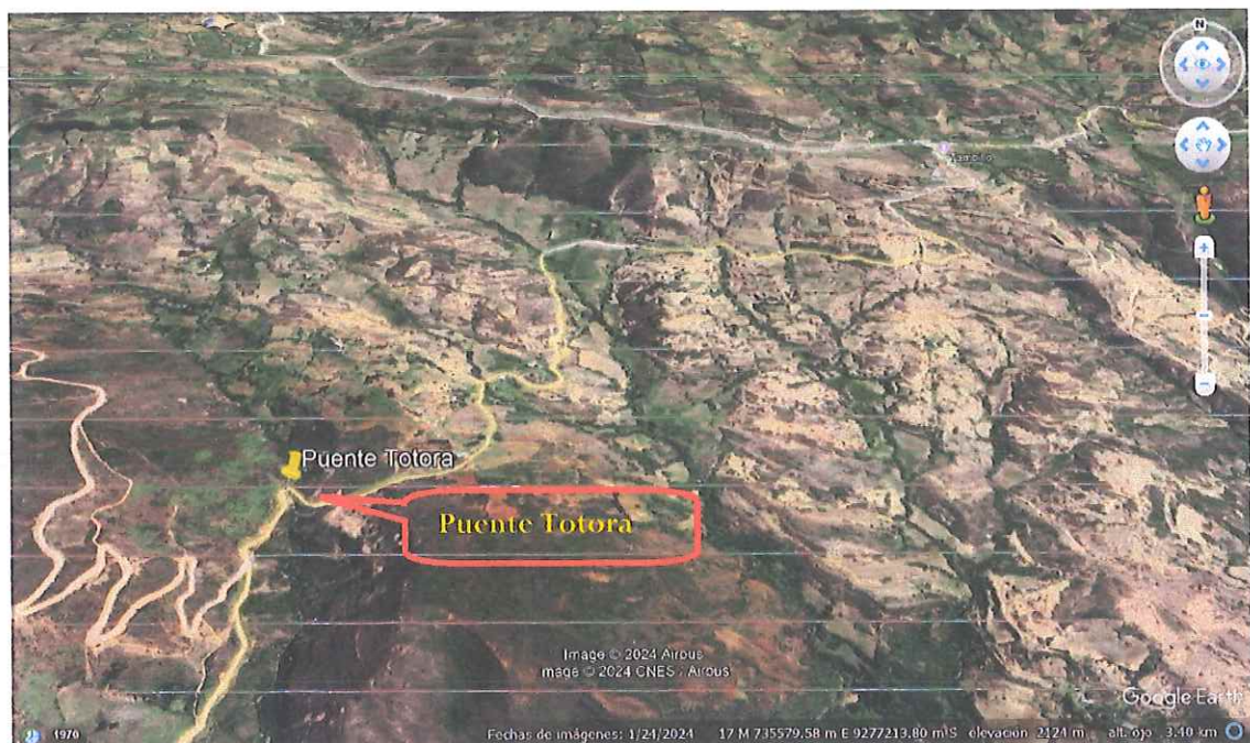
Imagen N° 04: Localización del Proyecto.