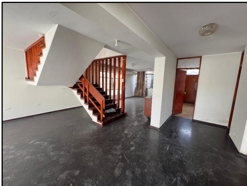
Ilustración 2 Casas de Servicios Villa Militar La Floresta - Interior

Cronograma de actividades, conteniendo planificación o desarrollo de actividades. Relación de equipos, herramientas y materiales que ingresarán al local y que servirá para la ejecución de las actividades, según corresponda.