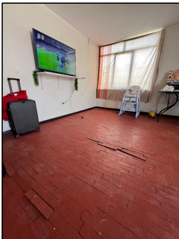
Ilustración 6 Casas de TCOS y SO Villa Militar Samegua - Pabellón B