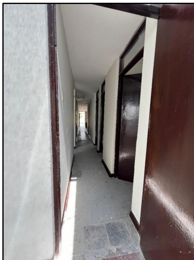
Ilustración 7 Casas de Oficiales Villa Militar Samegua