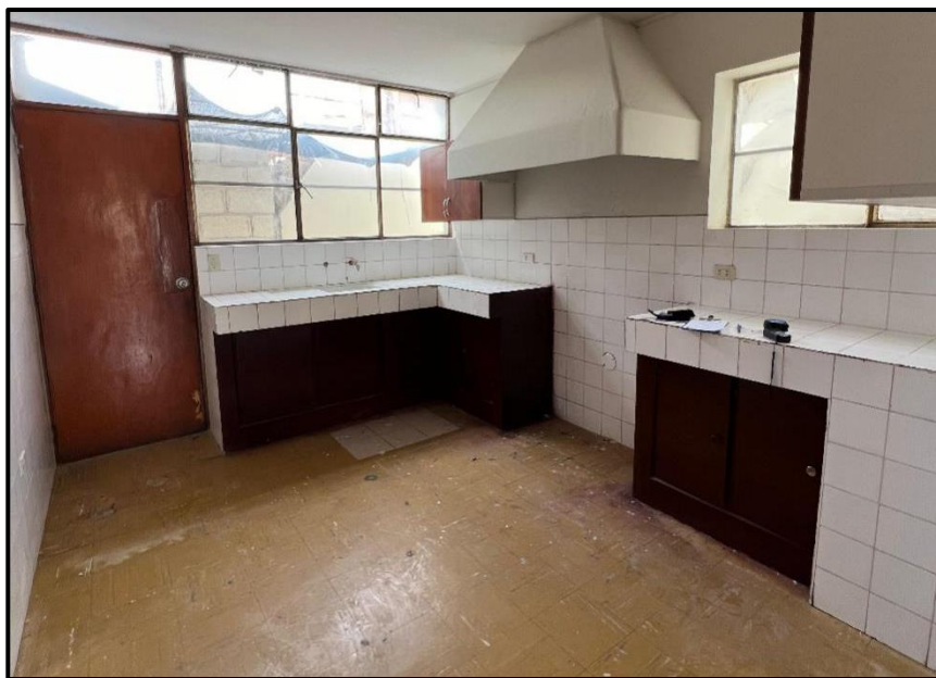
Ilustración 3 Casas de Servicio Villa Militar la Floresta - Interior Cocina