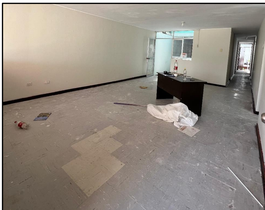
Ilustración 5 Casas de Oficiales Villa Militar Samegua