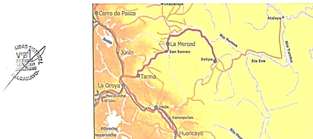
Cuadro N° 01: