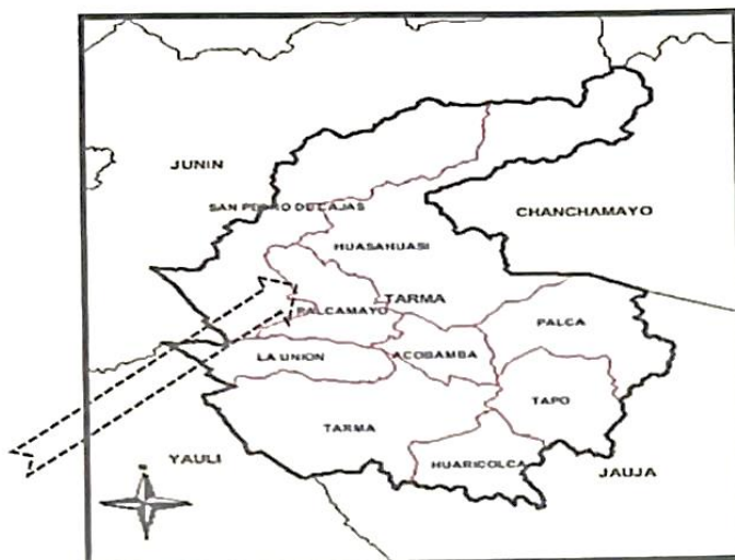
Gráfico: Mapa de Ubicación del Proyecto, Distrito de Palcamayo- Tarma Junín