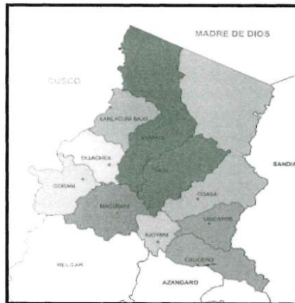
imagen 1: Ubicación del distrito de corani

imagen 2: Ubicación, del provincia de carabaya