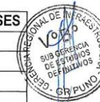
Cuadro N° 07 (Participación del Personal Clave)