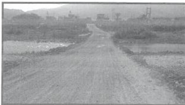
Vía actual realizada con material propio