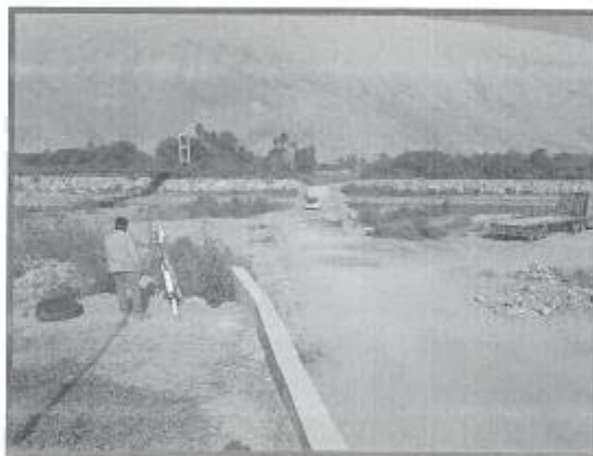
Trocha actual por donde pasan los vehículos, en riesgo en tiempos de lluvia.