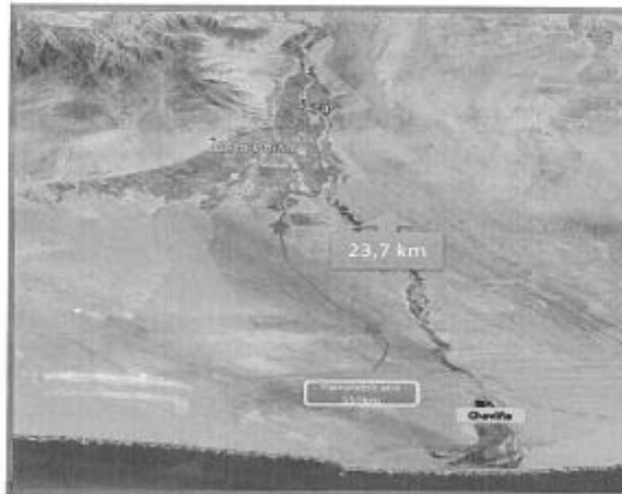
Accesibilidad desde la Panamericana hasta Acari