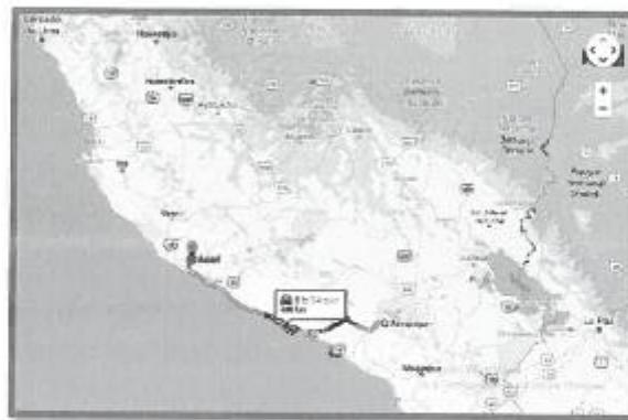
Accesibilidad desde Arequipa a Acari

Desde Arequipa hasta Acari se encuentra asfaltada en condiciones aceptables, teniendo que recorrer 480 Km hasta la ubicación del puente a construir.