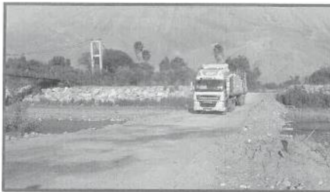
Trocha actual por donde pasan los vehículos, en riesgo en tiempos de lluvia.