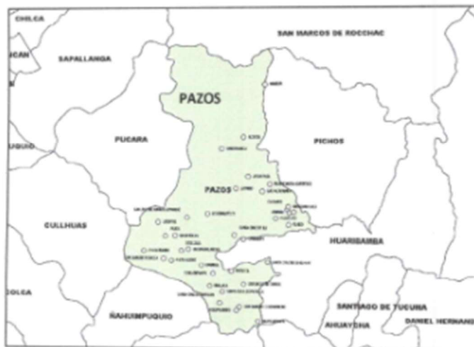
Figura N° 2 – Centros Poblados del Distrito de Pazos.