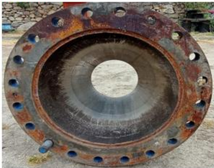
ASIENTO LADO DELANTERO