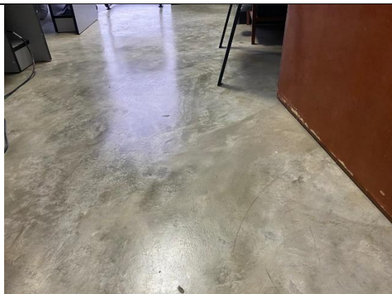
Fotografía 12. Oficina de saneamiento, en el 2do piso del bloque B.