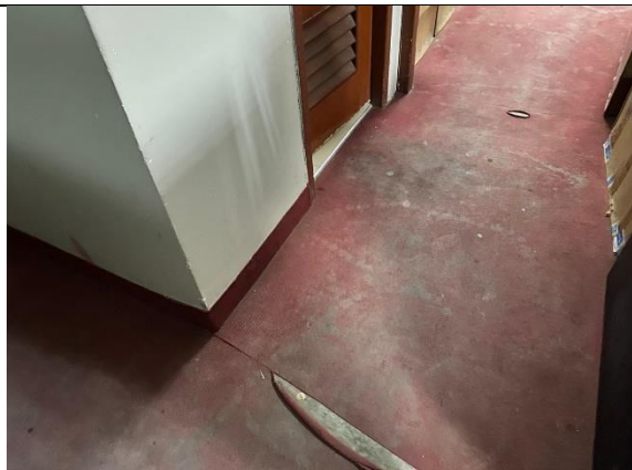
Fotografía 7. Oficina de tramite documentario de infraestructura, en el 1er piso del bloque B.