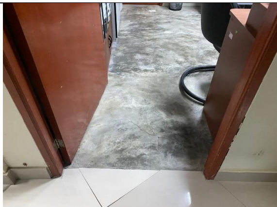
Fotografía 11. Oficina de Jefatura de liquidaciones, en el 2do piso del bloque B.