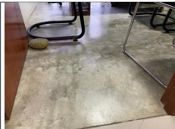
Fotografía 13. Sala de reuniones, en el 2do piso del bloque B.