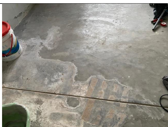
Fotografía 16. Deposito 1, en el 2do piso del bloque C.