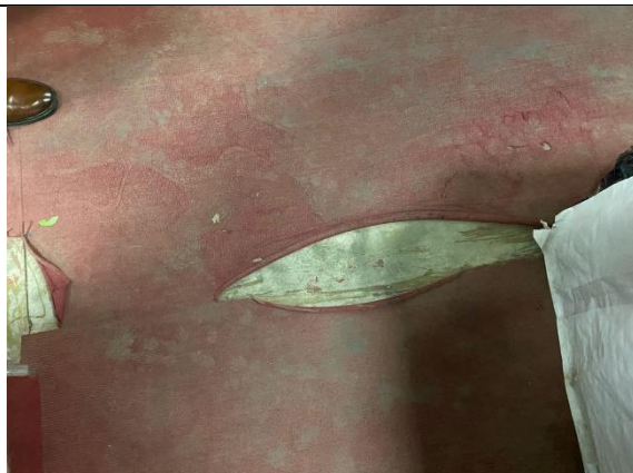
Fotografía 8. Oficina de obras, en el 1er piso del bloque B.