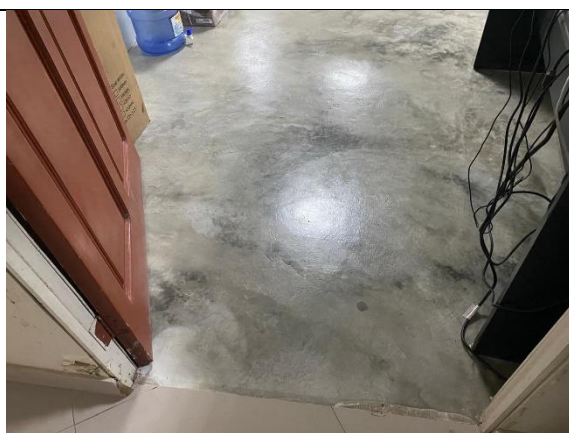
Fotografía 10. Oficina de administración de vivienda, en el 2do piso del bloque B.