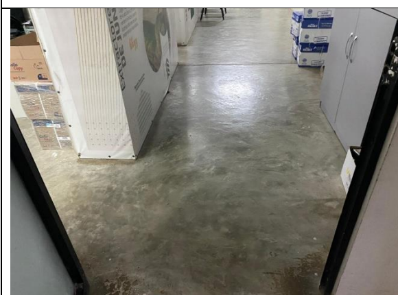
Fotografía 15. Oficina de recurso medioambientales, en el 2do piso del bloque C.