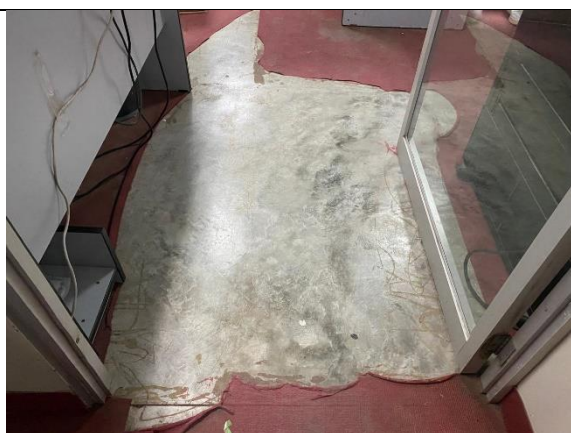
Fotografía 9. Oficina de proyectos y estudios, en el 1er piso del bloque B.