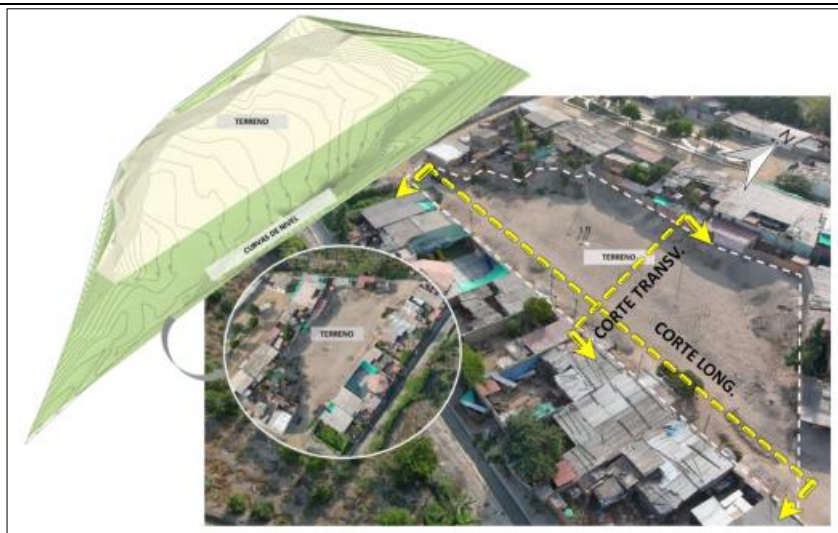
Figura N° 4: Esquema de Ubicación y Acceso al área a intervenir