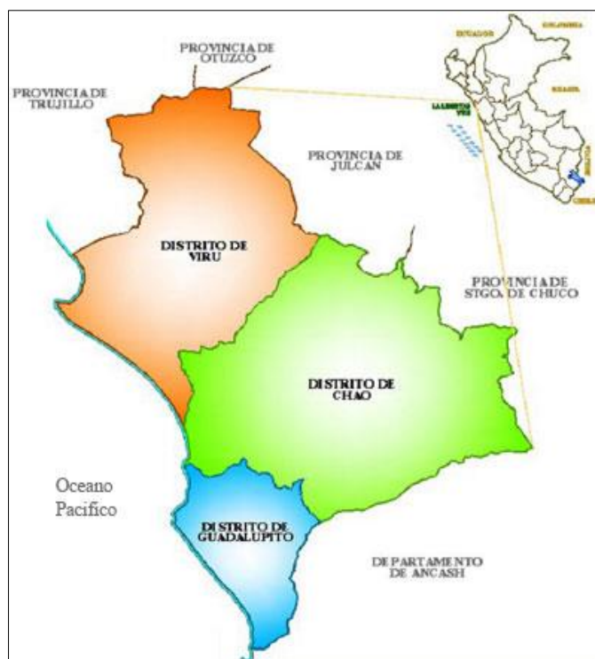
Figura N°02: Ubicación del Distrito de Chao