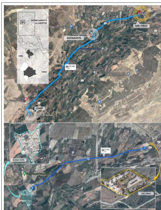
Figura N° 3: Esquema de Ubicación General