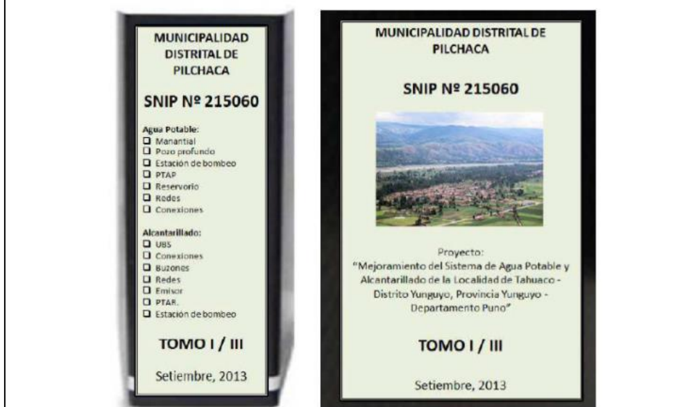
Figura 1. Forma de presentación del Expediente Contenido