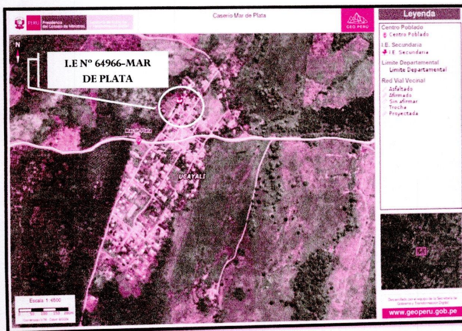
Ilustración 1. Vista Satelital de la Ubicación de la IE en el caserio Mar de Plata.